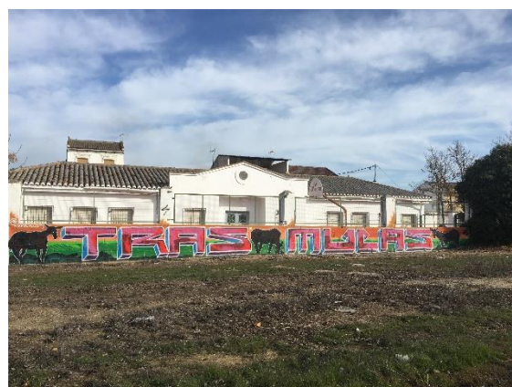
Ecole du village convertie en bibliothèque