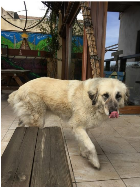
Maya, la chienne.