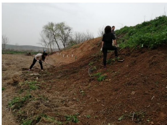
Aménagement de « El barranco » pour aider des voisins.

Voici comme promis quelques photos [...].