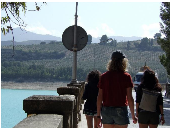
Excursion au lac "Los Bermejales"