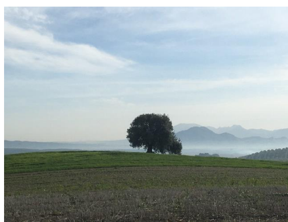
Vue sur un sentier de ballade