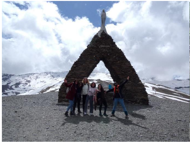
Photo avec les volontaires à Sierra Nevada