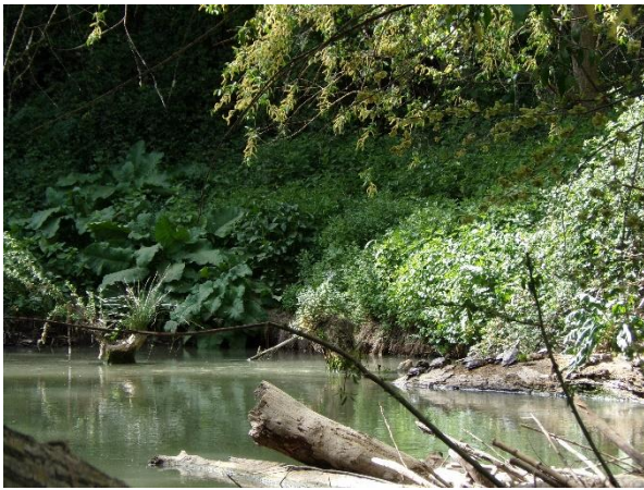
Rivière "Rio Genil"