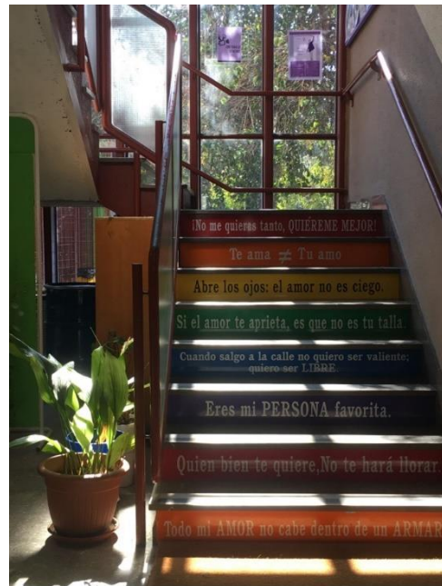
Les escaliers de l'école

Jeudi dernier on s'est rendus à Grenade dans l'Alhambra et le jardin « Carmen de los martires », c'était magnifique ! On y est allés parce qu'il y a un projet avec une autre association qui consiste à définir un parcours de visite pour les personnes aveugles, il fallait donc penser à inclure des lieux qui faisaient appel à des sens comme l'ouïe avec un ruisseau, l'odorat avec des fleurs, etc.