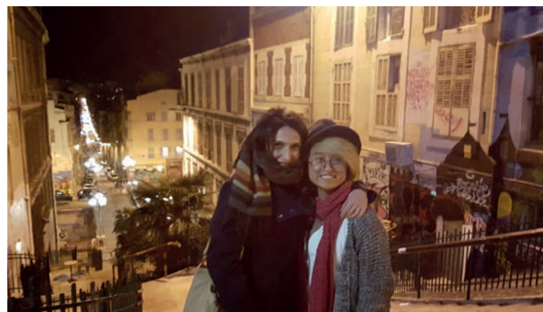
Photos prises lors du séminaire de lancement EYES sur Marseille en Décembre 2015.

échanger sur les bonnes pratiques et à relever des défis communs.