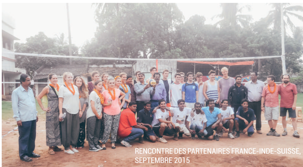
RENCONTRE DES PARTENAIRES FRANCE-INDE-SUISSE, SEPTEMBRE 2015

A cette occasion, Eurasia Net a renforcé ses liens de coopération avec JRP qui reçoit également des volontaires en Service civique français avec le programme de SCFI/EurasiaTwin.